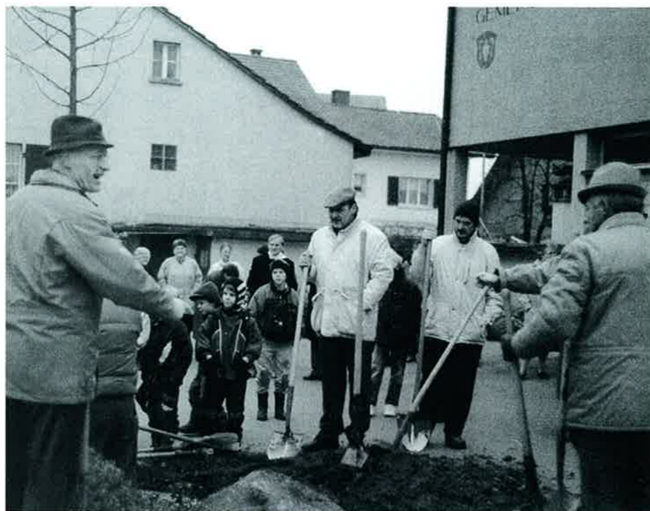
Eine Dorflinde wird gepflanzt, gestiftet von der Nachbargemeinde Andelfingen (Bezirkshauptort) im Jubiläumsjahr 1991 (Dorfplatz mit Gemeindehaus und Dorfladen).

Ausschlaggebend aber ist wohl das Engagement der Volkemerrinnen und Volkemer. Fast alle Einwohner sind oder waren in irgendeiner Form für die Gemeinde tätig. Die Bürger interessieren sich stark für die Geschehnisse im Dorf und in der Region; die Beteiligung an Wahlen und Abstimmungen liegt weit über dem Kantonsmittel. Alle Gemeinschaftsanlässe sind gut besucht – die Volkemer sind berühmt für ihre Festfreude. Auch wenn die Gemeinde vom Finanzausgleich abhängig ist, hat sie ihre Lebenskraft und Daseinsberechtigung nicht verloren. Es wäre