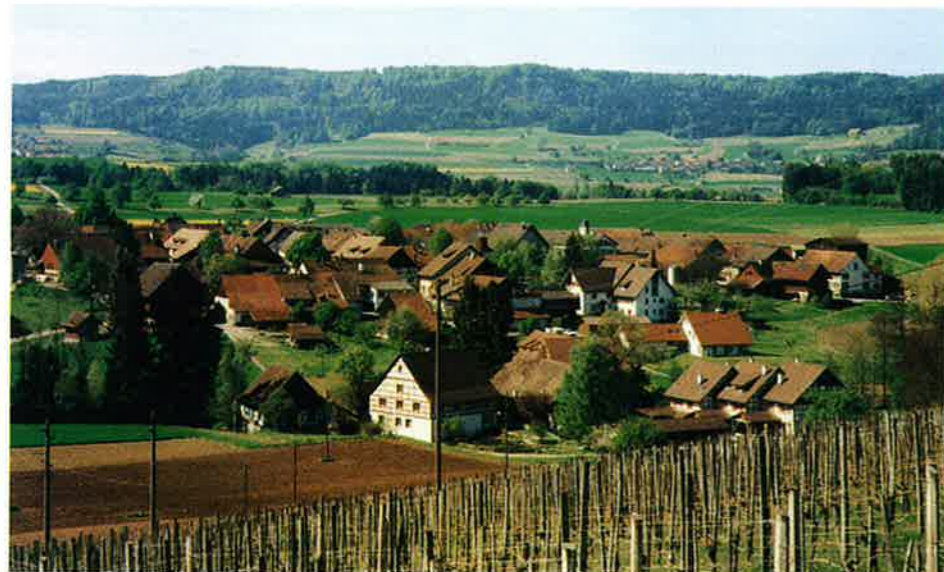
Dorfansicht von Norden, mit dem Irchel im Hintergrund.

rungsstarke wie Greifensee, Schwerzenbach oder Henggart. Charakteristisch für Volken ist die starke Prägung des Dorfes durch Landwirtschaft und Weinbau, die in der Gemeinde allgegenwärtig sind.