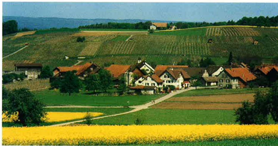
Dorfansicht von Süden: im Hintergrund der Worrenberg.

Mit Abstand ist Volken im Zürcher Weinland die bevölkerungsärmste selbständige Gemeinde im Kanton Zürich. Gemessen an der Grundfläche lässt das Dorf immerhin siebzehn Gemeinden im Kanton hinter sich, darunter so bevölke-